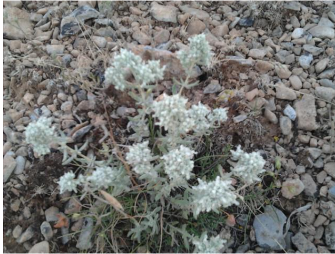
Εικόνα 9: Χαμαίντρο – Teucrium chamaendrys