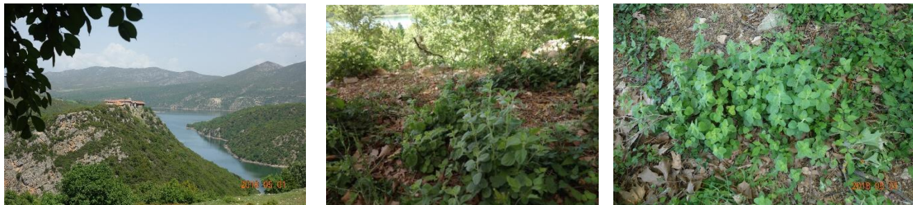
Εικόνα 14: Μέντα- Mentha sp. ( pubesens , rotundifolia )

Μέντα- Mentha sp. ( pubesens , rotundifolia )