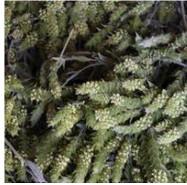
Εικόνα 6: Σιδηρίτης