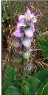
Εικόνα 12: Αη γιάννης