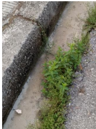
Εικόνα 13: Δυόσμος, άισμα, αδιάσμος Mentha spicata