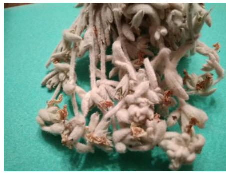
Εικόνα 7: Τσάι βουνού