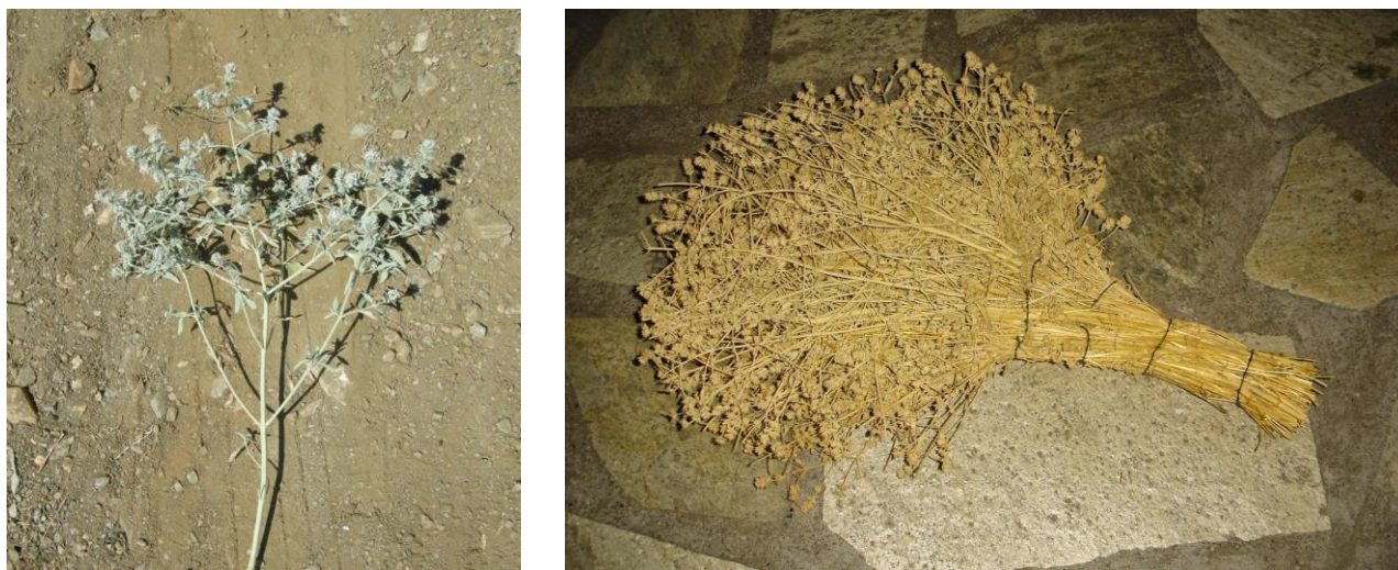
Εικόνα 15: Φουκάλι – Marrubium peregrinum