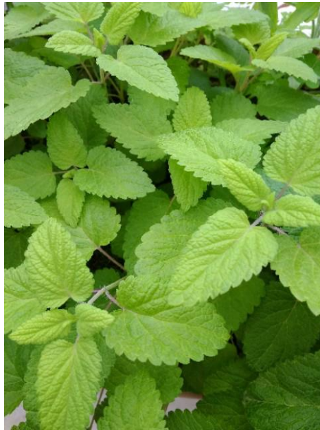
Εικόνα 17: Μελισσόχορτο - Melissa officinalis