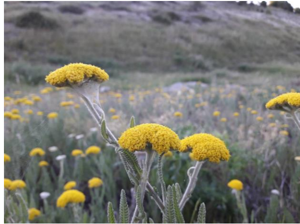
Εικόνα 16: Φουκάλι