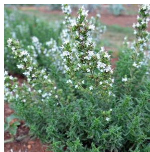
Εικόνα 8: Τσάι ριγανάτο, ρούσικο, πράσινο