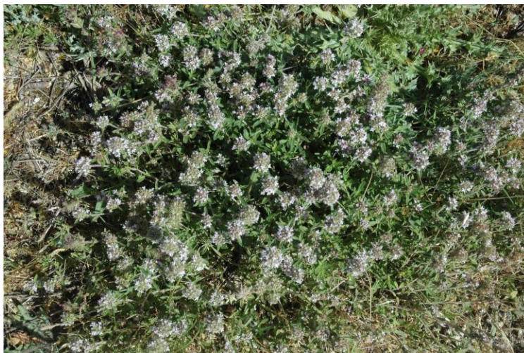
Εικόνα 10: Τσιμπρίτσα - Thymus sp.