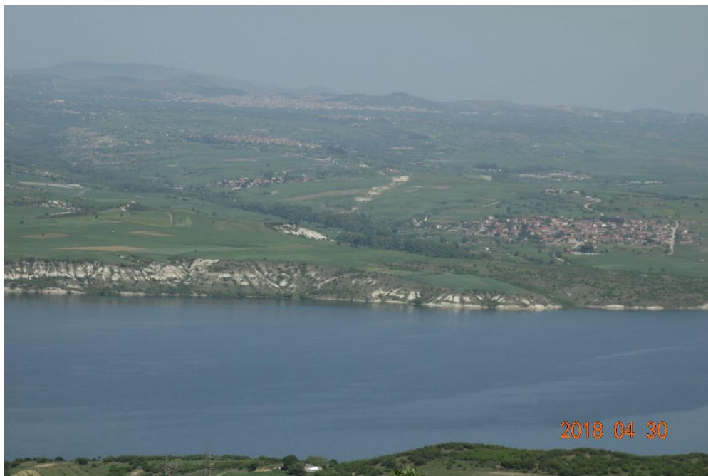
Εικόνα 1: Λίμνη Πολυφύτου

Φαρμακευτικό φυτό (medicinal, therapeutical), είναι κάθε φυτό που περιέχει ένα ή περισσότερα δραστικά συστατικά, τα οποία έχουν την ικανότητα να προλάβουν, να ανακουφίσουν ή να θεραπεύσουν ασθένειες. Παράδοση, είναι η άγραφη διήγηση, αρχές, κανόνες, που κληροδοτούνται από γενιά σε γενιά, στην περίπτωση μας αφορά τα αρωματικά φυτά που γνωρίζουν από αιώνες οι κάτοικοι αυτής της περιοχής.