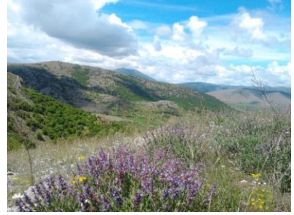
Εικόνα 11: Καντηλίνα, φασκόμηλο