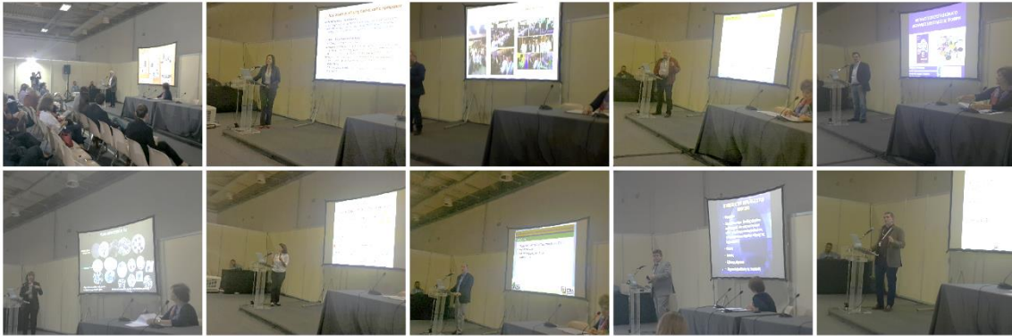
Από τα αριστερά προς τα δεξιά