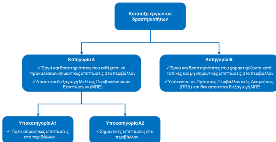
Διάγραμμα 2: Κατάταξη έργων και δραστηριοτήτων με βάση το ν. 4014/2011

Σε ό,τι αφορά την εθνική νομοθεσία για την περιβαλλοντική αδειοδότηση έργων και δραστηριοτήτων δημόσιου και ιδιωτικού τομέα, η οποία και εφαρμόζει τις παραπάνω προβλέψεις, ισχύουν οι διατάξεις του ν. 4014/2011 «Περιβαλλοντική αδειοδότηση έργων και δραστηριοτήτων, ρύθμιση αυθαιρέτων σε συνάρτηση με δημιουργία περιβαλλοντικού ισοζυγίου και άλλες διατάξεις αρμοδιότητας του Υπουργείου Περιβάλλοντος», σύμφωνα με τις οποίες τα έργα και δραστηριότητες κατατάσσονται σε δυο κατηγορίες (Α και Β, με την κατηγορία Α να υποδιαιρείται στις υποκατηγορίες Α1 και Α2), ανάλογα με τις επιπτώσεις τους στο περιβάλλον.